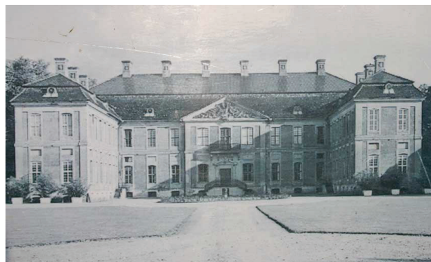
Le château de Finkenstein, tel que Napoléon et Talleyrand l'ont connu...

Deux jours avant l'arrivée de Talleyrand, c'est Hugues Maret qui, le 4 mai signe le traité de Finckenstein avec la Sublime Porte (Empire ottoman). 17