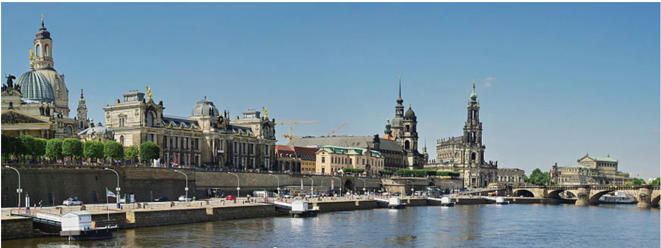
Dresde: vue générale depuis l'Elbe