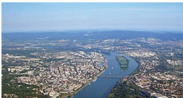
Mayence. Vue aérienne. La ville historique est à gauche, le confluent du Rhin et du Main en bas. Wiesbaden est au fond à droite.

Le 27 encore, jour de son départ, une lettre à Napoléon qui en est déjà reparti.