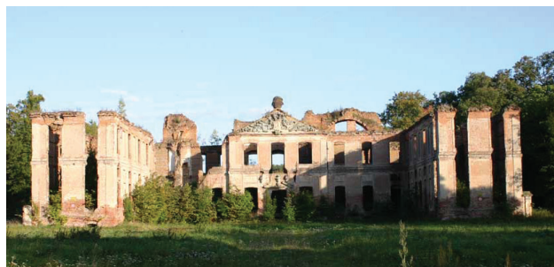
Le même, dans son état actuel