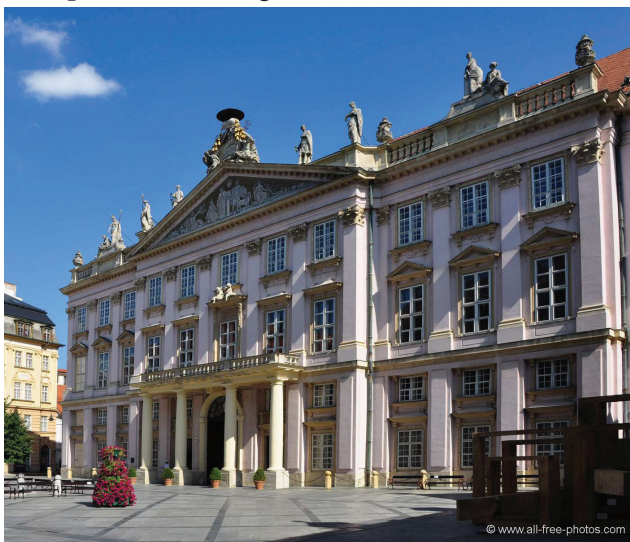
Le Palais primatial de Bratislava, où Talleyrand signa la paix dite «de Presbourg»

Au terme de la 3 e coalition (1805) d'états européens contre la France de Napoléon, après Austerlitz et le traité de Presbourg – signé par Talleyrand – l'Autriche est expulsée d'Allemagne et d'Italie, mais Anglais, Russes, Napolitains et Suédois poursuivent la guerre.